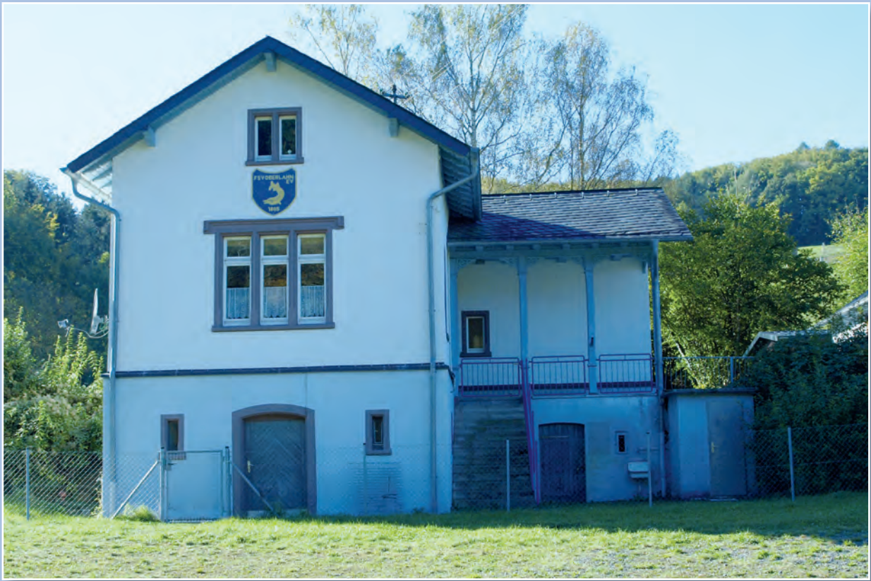
Vereinshaus des Fischerei-Sportverein Oberlahn e.V. 1885 in Falkenbach