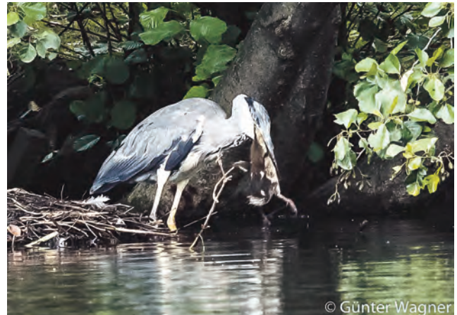
... dann wird sie verschluckt

Fischen - im Teich befinden sich vorwiegend Dreistachelige Stichlinge - ernährt er sich wahrscheinlich in der Brutzeit überwiegend von Küken der Enten, Blässrallen, Teichrallen und Zwergtauchern. Auffällig in diesem Teich sind auch die vielen Nachgelege der Wasservögel über einen langen Zeitraum.