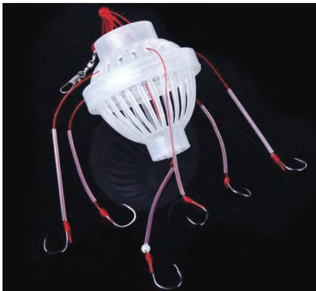
Solch ein „Futterkörbchen“ wurde an der Lahn gefunden und verführt sicher einige Angler dazu, es auch zu verwenden. Es ist nicht erlaubt!

(wk) Im letzten LAHNFISCHER hatten wir auf Seite 7 über ein an der Lahn in der Lahn gefundenes und zum Angeln nicht erlaubtes Anfütterungskörbchen mit 6 Haken gefunden. Wir dachten es wäre ein Import aus dem Osten, doch es ist offensichtlich auch bei uns zu kaufen, denn wir haben es in einem Katalog entdeckt. Für viele unserer deutschen Angler ist scheinbar das Angeln nicht mehr in erster Linie die Spaß an der Natur, die Erholung und das Ausleben der Passion zum Fischfang sondern eventuell sogar wieder der Nahrungserwerb. Wir freuen uns – und das ist auch der vernünftige Grund überhaupt Angeln zu gehen, wenn man Fische fangen will und diese auch in der Küche zubereiten und verzehren will. Ob man alles anwenden oder ausprobieren sollte, um die zu fangenden Fischmengen zu erhöhen, ist fraglich, da man doch nur Fische „in haushaltsüblichen Mengen“ fangen sollte und darf. Dass Angler Fische fangen, um sie zu essen, ist eigentlich klar und nicht zu diskutieren, denn die Fische aus unseren Gewässern sind alle essbar und richtig zubereitet mit den richtigen Gewürzen, sogar eine richtige Delikatesse.