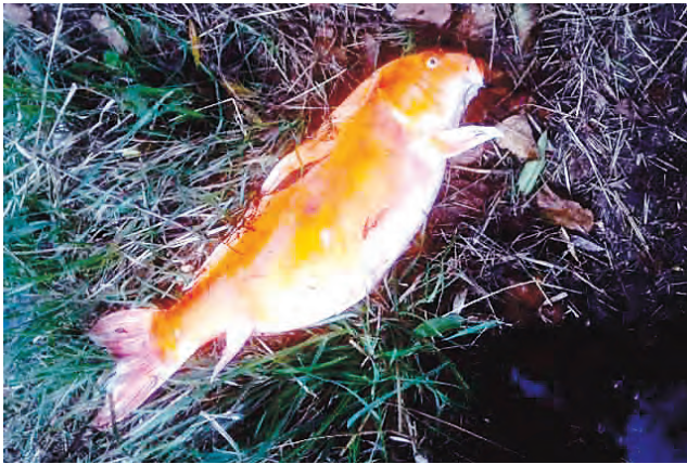
Koi bei Ahausen gefangen

heimischen Arten nicht resistent sind. Das beste Beispiel sind die amerikanischen oder vom Balkan stammenden Krebsarten, die unsere heimischen Edelkrebse fast ausgerottet haben.