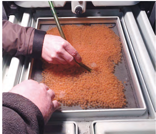
Hier ein Teil der frisch befruchteten Lachseier