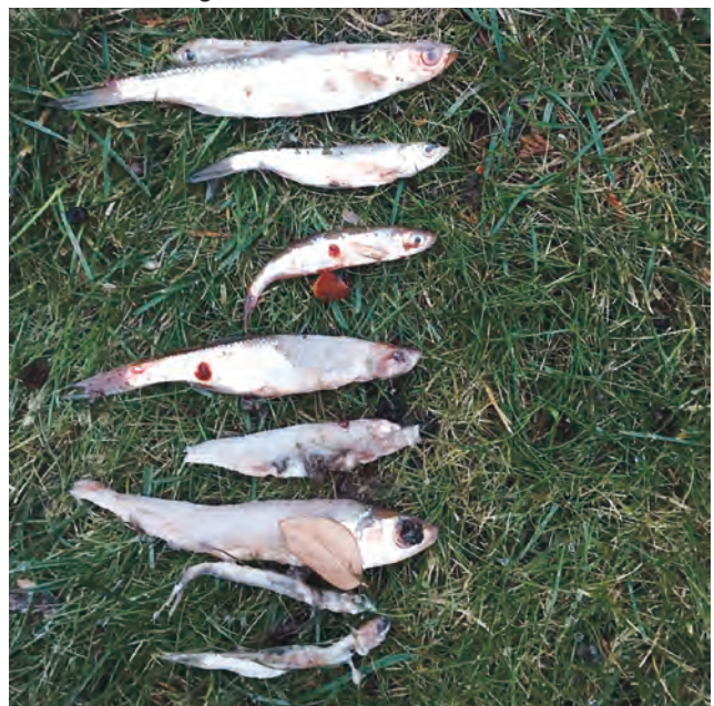
Alle im Magen eines 70er Hechtes

(wk) Hechte sind im Gegensatz zu Welsen wahre Fressmaschinen, wie das nachfolgende Foto von Frank Godlewski belegt. Hechte haben diese als