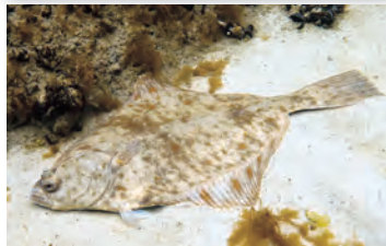
Fisch des Jahres 2017 Die Flunder ( Platichthys flesus )

Bitte beachten Sie strikt die Fischereibedingungen! Legen Sie sich nicht mit den Fischereiaufsehern an und zeigen Sie Papiere u. Fang! Lassen Sie keinen Abfall am am Angelplatz liegen! Verhalten Sie sich immer un- auffällig und korrekt gegen- über andern Lahn-Nutzern!