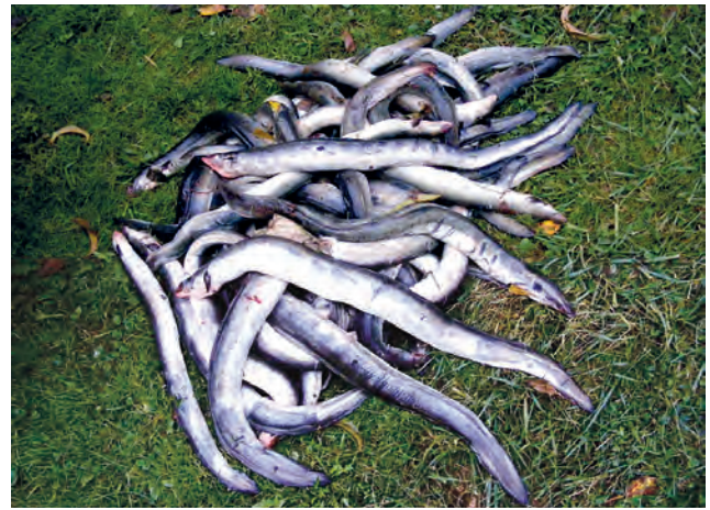
50 kg massakrierte Blankaale aus der Lahn!

Im nächsten Jahr finden Bundestagswahlen statt und es ist bitter nötig, dieses Thema in der Presse den Menschen nahe zu bringen. Wir werden überlegen, wie wir dies bis dahin wirksam organisieren können. Alle vernünftigen Menschen werden uns in diesem Ansinnen unterstützen und denen, die hierfür verantwortlich sind, das Mandat auf Dauer entziehen!