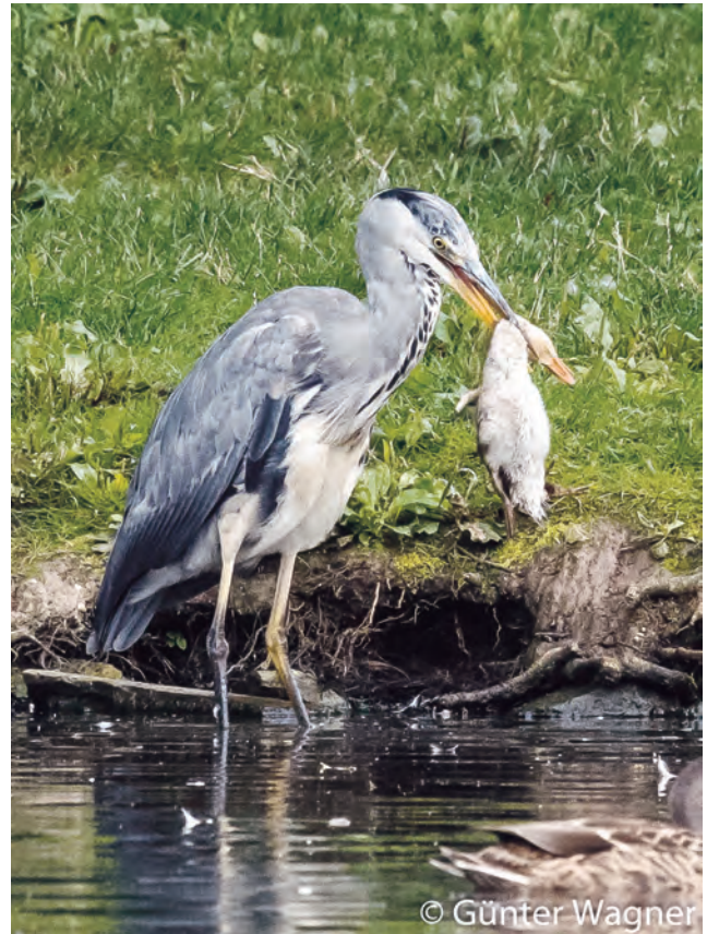
Jungente wird geschüttelt bis sie tot ist ....

Zusammenfassend kann man sagen, dass dieser Graureiher im Schlosspark sich spezialisiert hat. Neben