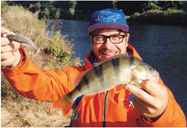
Sreffen mit Barsch in Runkel

Hechtlady im Kescher. Die Lahn kann. Es hat mehr wie genug Fisch hier auf unserer Strecke.