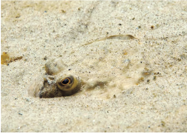
Flunder, oben im Sand eingegraben

zwei bis drei Kilogramm. Eine Flunder kann bis zu 20 Jahre alt werden.